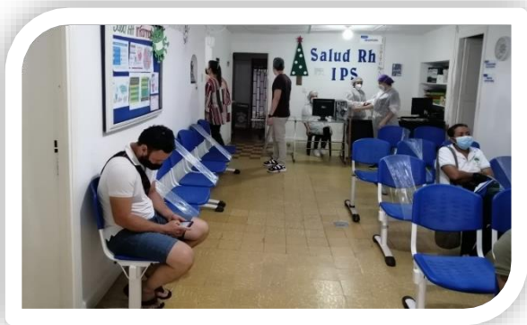
Distanciamiento Social en áreas comunes